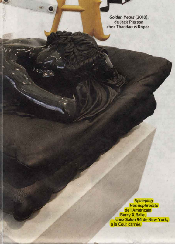
Golden Years (2010), de Jack Pierson chez Thaddaeus Ropac.