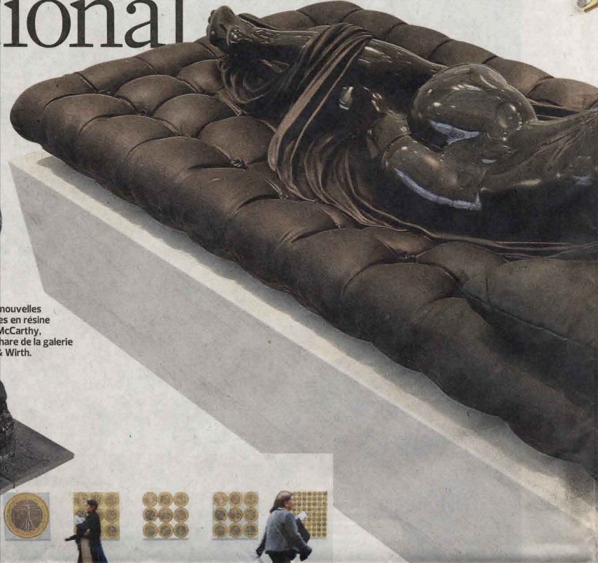
Euroman (2010), l'homme de Vitruve de Gabriel Orozco, chez Chantal Crousel. Une reproduction pigmentaire sur fond or à 120 000 dollars.