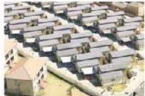
DAVID GOLDBLATT, Scènes de crime

Mélange de candeur, de forfanterie et de provocation (memorable Avignon !), ce Flamand à la folie des grandeurs. Il faut lui rendre justice : elle s'accorde bien avec le cadre majestueux de la Scuola Grande della Misericordia (Cannaregio). Sur l'estrade à la feuille d'or, le visiteur en patins de feutre pierre jusqu'à sa Pietà de marbre : il est le Christ, citadin en costume ensablé de papillons et d'escargots : la mort à la face creuse le tient dans ses bras. Vonitas voritatum.