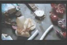
CHRISTIAN MARCLAY, L'œuvre du temps