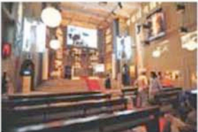
CHRISTOPH SCHLINGENSIEF, La mort du rebelle