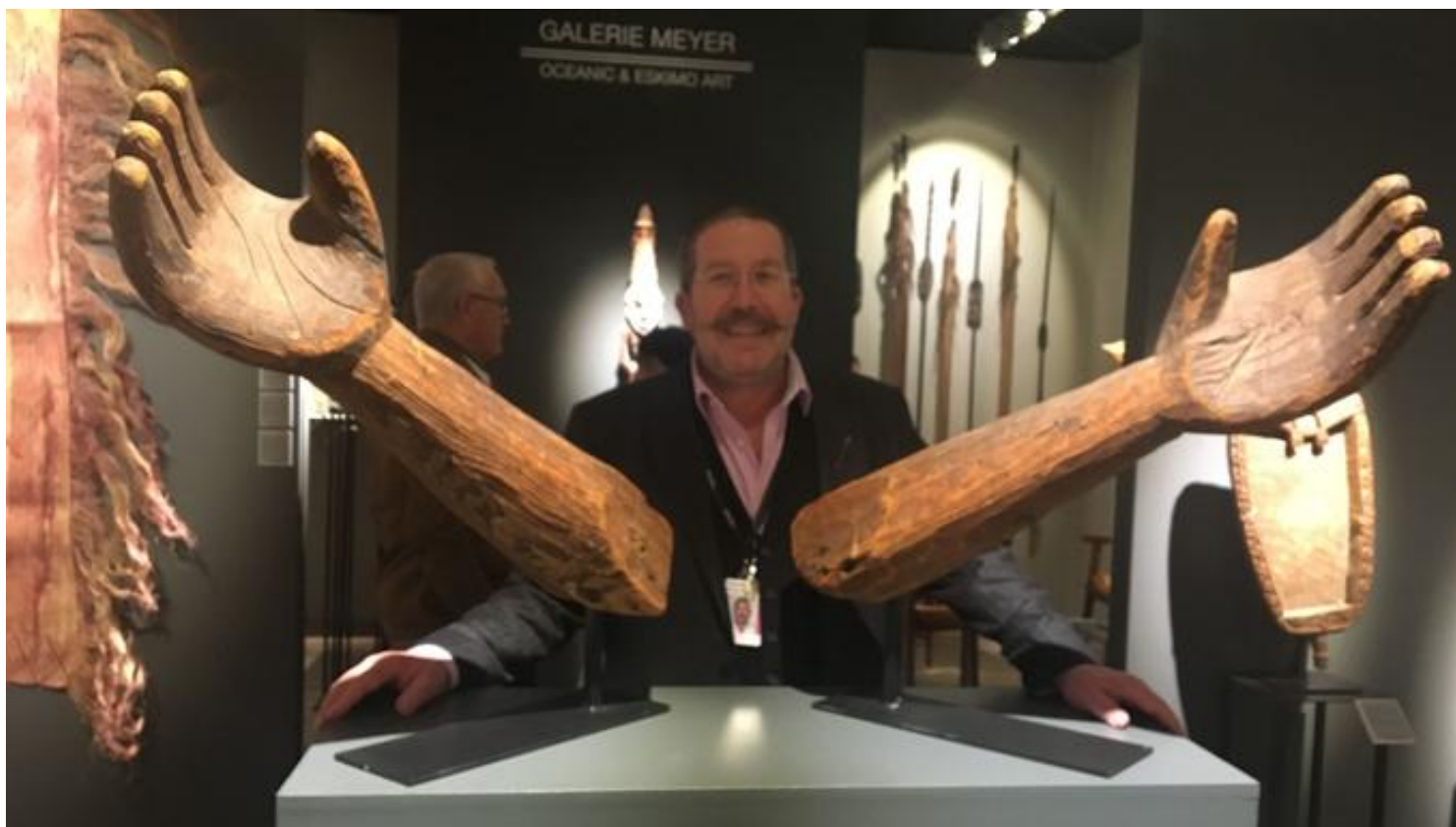
Tefaf Maastricht 2019: les dix coups de coeur du Figaro Anthony JP Meyer

Par Béatrice de Rochebouët ( http://plus.lefigaro.fr/page/beatrice-de-rochebouet ) | Publié le 17/03/2019 à 17:12