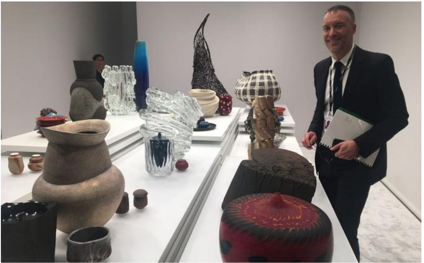
Une sélection de pièces signées par des artistes du Japon. Le Figaro

. L'écrin d'or de Jose-Maria Sert: Pour servir d'écrin à huit vaisseaux en argenterie d'Augsburg, Ulm et Nuremberg, les frères Kugel, duo de marchands parisiens, ont reconstitué le décor de peintures d'or de la résidence Kavanagh à Buenos-Aires exécutée par Jose-Maria Sert ( http://www.lefigaro.fr/culture/2012/06/01/03004-20120601ARTFIG00412-le-tiepolo-du-xxe-siecle.php ), (Barcelone 1874-1945). Il s'agit de 28 panneaux représentant une allégorie du travail et des scènes de pêche. Dans la pièces voisine, trônent deux cabinets (et non une paire) créés à Anvers, vers 1650, par Willem Forchoudt. Ils sont incrustés de fabuleux camées. Ils sont proposés à moins de 2 millions d'euros.