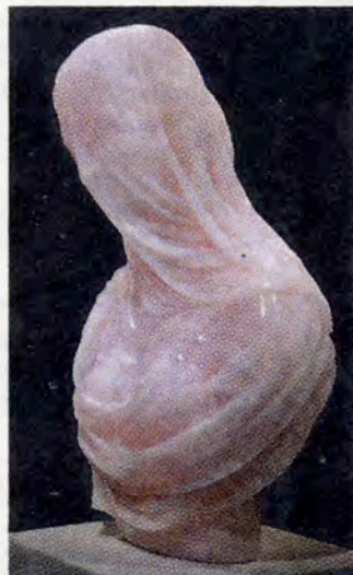
Una scultura di Barry X Ball

tamente dal salotto televisivo scientifico di Quark, arriverà la Colonna Traiana in 3D realizzata da Piero Angela e da Paco Lanciano. Un'installazione suggestiva che riprodurrà il monumento a grandezza naturale: la sensazione per lo spettatore sarà quella di volarci in-