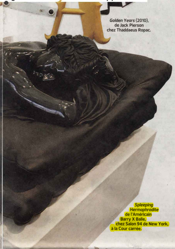
Golden Years (2010), de Jack Pierson chez Thaddaeus Ropac.