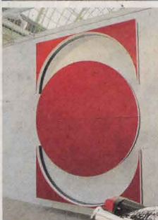
Tête en plâtre synthétique de Thomas Hauseago (en haut). Haut-relief de Daniel Buren (ci-dessus). Harley Davidson peinte par Olivier Mosset (ci-contre).