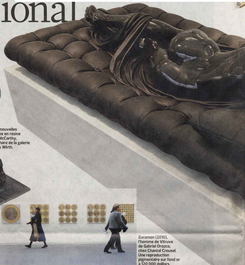
Euroman (2010), l'homme de Vitruve de Gabriel Orozco, chez Chantal Crousel. Une reproduction pigmentaire sur fond or à 120 000 dollars.

nouvelles es en résine McCarthy, hare de la galerie & Wirth.